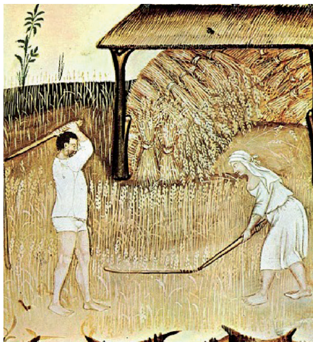
Mietitura del frumento (Tacuinum Sanitatis Casanatense, sec. XIV)