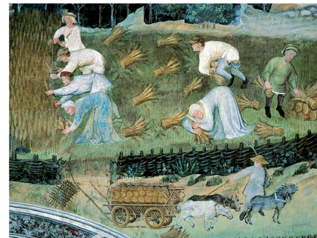
Lavori agricoli: ciclo dei mesi, agosto (Castello del Buonconsiglio, Trento, 1390-1400)