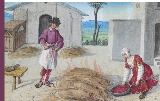
Lavori agricoli (Jean Poyer, Ore di Enrico VIII, anno 1500 circa - Morgan Library, New York)