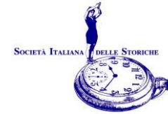
Illustrazione di copertina: Pat Carra

Contatti: segreteria@societadellestoriche.it presidenza.sis@gmail.com